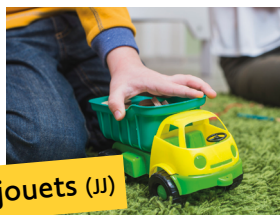
Jeux et jouets (JJ)