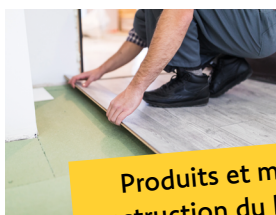
Produits et matériaux de construction du bâtiment (PMCB)

Le tri actuellement en place se trouve modifié par ces nouvelles filières.