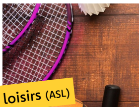
Sport et loisirs (ASL)

Pour répondre à l'obligation donnée par la nouvelle réglementation (loi AGEC) de nouvelles filières de tri sont mises en place dans les déchèteries du Haut-Doubs*: