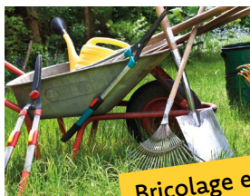
Bricolage et jardin (ABJ)